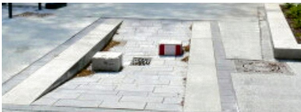
So sieht eine passive Busschleuse aus. Busse können passieren, Pkw nicht.

Lösungen mussten her, um das nächtliche Treiben der See-Besucher mit vier Rädern zu stoppen. Schon in der Nachbarschaft, an der Phoenixseestraße, gab es Konsequenzen. Die Straße wurde kurzerhand in eine Sackgasse umgewandelt - durch eine Straßensperre in Höhe der Hausnummer 7. Seit April 2022 hat diese Sperrung Bestand.